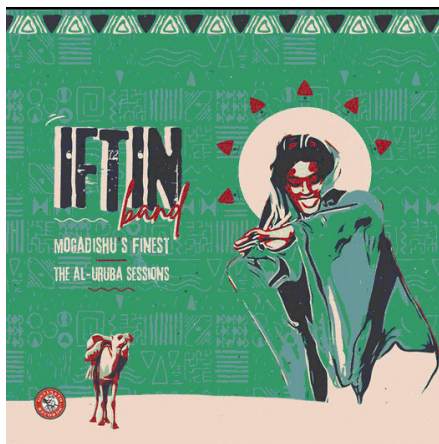
Iftin Band ze somálského Mogadiša. Reedice newyorského vydavatelství Ostinato Records