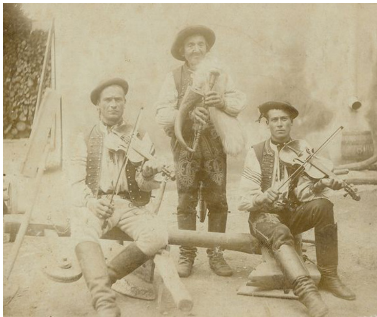
3. Gajdy se zahnutou melodickou pišťalou, do níž tanečníci vhadzovaly gajdošovi peníze. Hudecké trio Holásků-Minárků z Kopanic, 1895. / A bagpipe with a curved melody pipe into which the dancers threw money to the bagpiper. Folk musicians from the Kopanice Region (East Moravia), 1895 (musicians from the Holásek family, called Mináříci).