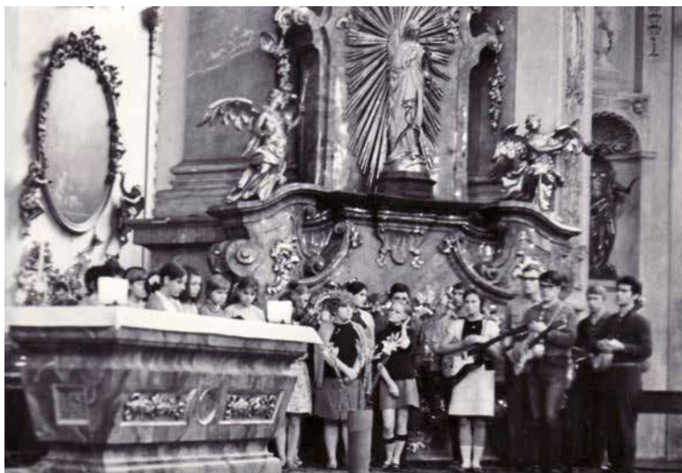
Obr. 2. U sv. Ignáce v Praze na jaře 1968.