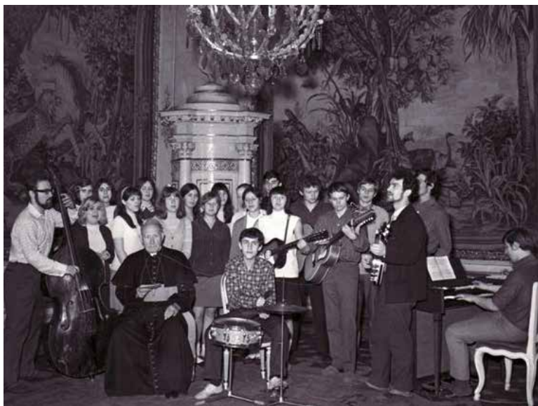
Obr. 1. Skupina Poutníci s biskupem Tomáškem v květnu 1969.

„Jiné druhy liturgické hudby [než gregoriánský chorál], zvláště polyfonie, nejsou při slavení bohoslužby nijak vyloučeny, jestliže odpovídají duchu liturgických úkonů ve smyslu článku 30.“ 2 Článek 120 pak konstatuje: „Jiné nástroje [než varhany] lze připustit k bohoslužbě, pokud se hodí k posvátné službě nebo se pro ni dají přizpůsobit, pokud jsou ve shodě s důstojností chrámu a pokud skutečně přispívají k duchovnímu povznesení věřících. Souhlas k tomu dá podle svého uvážení příslušná územní autorita ve smyslu článků 22 § 2, 37 a 40.“ 3 Poněkud rozvolněné formulace vytvořily manévrovací prostor pro nejspíše nepředvídané