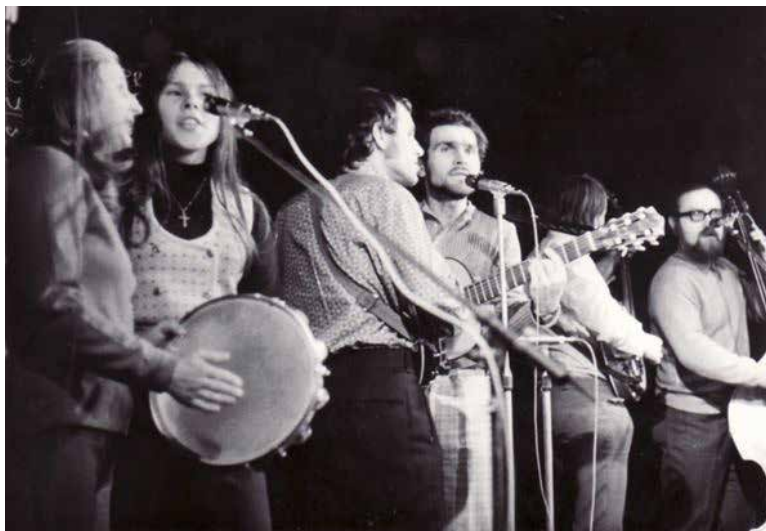
Obr. 6. V Malostranské besedě v únoru 1974.

skupina v redukované sestavě, víceméně jako folková kapela, hraje v květnu na Portě 73 v pražském Radiopaláci a v květnu i červnu v Malostranské besedě v pořadu Lokálka. Následuje v září Porta 73 v Českém Krumlově a čtyři koncerty v Malostranské besedě v pořadu Písně dlouhých cest ; další čtyři pak tamtéž počátkem roku 1974. Zcela poslední akce proběhly v roce 1976.