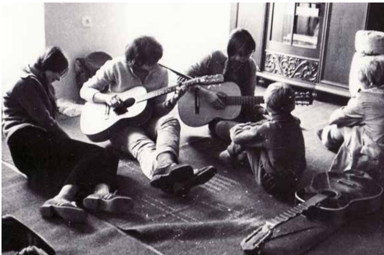
Obr. 7. V Mnichovicích v červnu 1972.