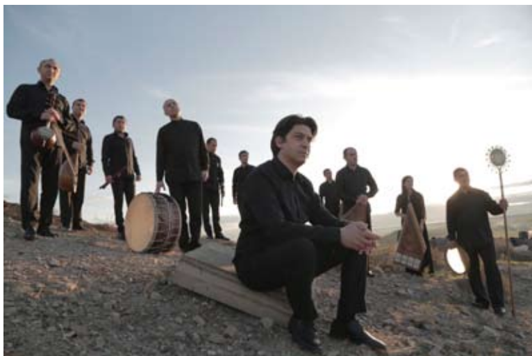
Gurdjieff Ensemble.