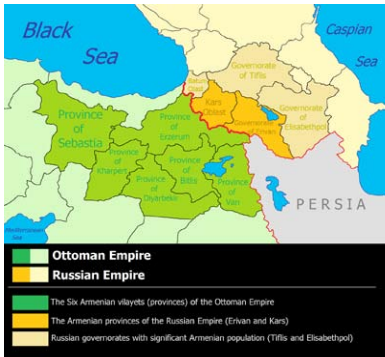
Obr. 1 – Území s arménským obyvatelstvom rozdelené medzi Ruské impérium a Osmanskou říši.

Zde je na místě historická a zeměpisná poznámka. Dnešní Arménie je jen zlomkem původního území z roku cca 1900, kdy Arméni žili v šesti provinciích Osmanské říše a v pěti provinciích Ruského impéria (srov. obr. 1).