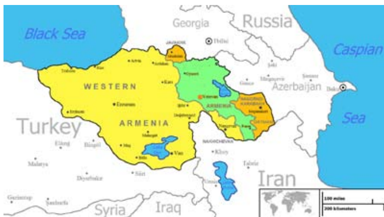
Obr. 2 – historický koncept „spojené Arménie“, mapa západních a východních území.

Hudbu arménských komunit před genocidou zachytilo několik sběratelů. Tím úplně prvním byl Sayat Nova (1712–1795), současník Mozarta, básník, skladatel, později i diplomat, a především bard, který zpíval a komponoval v arménštině, gruzínštině i perštině (Dorůžka 2014). V letech těsně před genocidou v komunitách Západní Arménie na území dnešního Turecka sbíral melodie kněz Komitas (1869–1935). Jeho zpěvníky slouží jako neocenitelný pramen hudebníkům napříč žánry i národnostmi a dnes z nich čerpají jazzmani i klasické ansámblы. Komitas studoval v Berlíně, podobně jako moravský sběratel lidových písní František Sušil byl kněz s hlubokým vztahem k hudbě svého národa. Několik let strávil sběratelskými